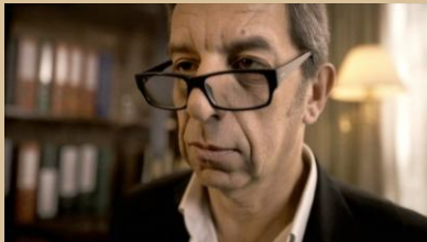
Diagnostic , de Fabrice Bracq